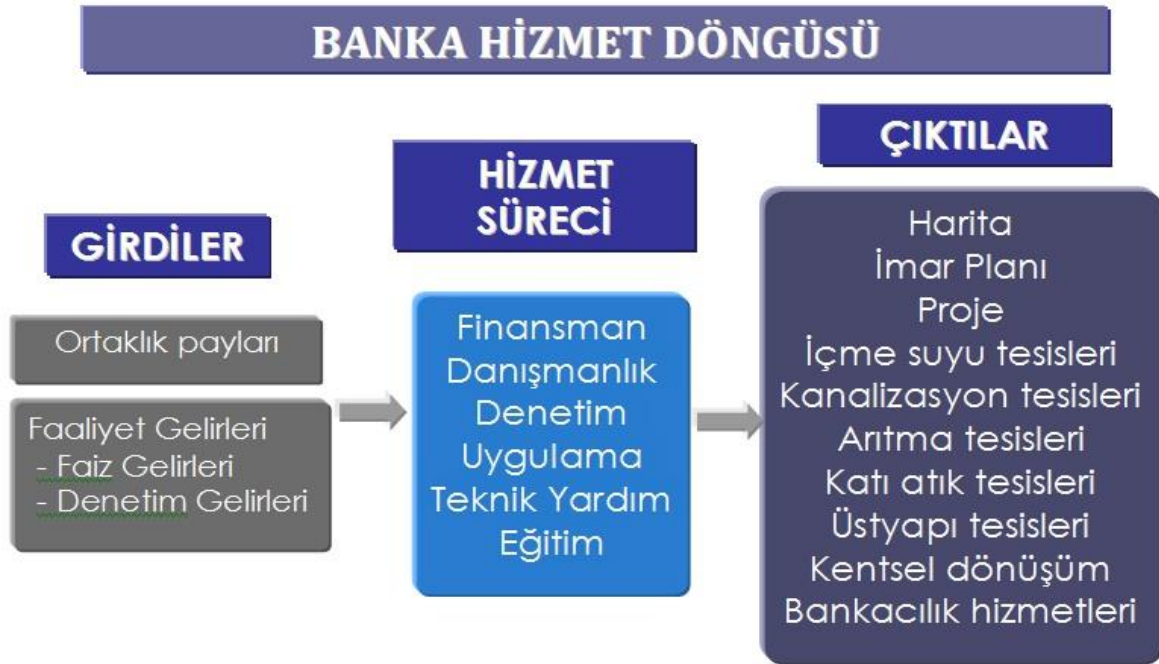
Şekil 2.1. İlbank A.Ş. hizmet döngüsü ( www.ilbank.gov.tr .)

Banka, ülkemizin daha modern bir yapıya kavuşması için elindeki kaynaklardan halkın refahını artırmak ve ihtiyaçlarını karşılamak için çeşitli çıktılar elde etmektedir. Banka'nın gelir kaynakları; kredilerden alınan faiz, komisyon ve fon gelirleri, kontrollük ve danışmanlık gelirleri, kaynak geliştirme faaliyetleri sonucunda elde edilen gelirler ve interbank piyasalarından fon transferi yoluyla elde edilen gelirlerdir. Banka, elindeki gelirleri ve özkaynaklarını kullanarak, harita işleri, imar planlama işleri, içme suyu işleri, kanalizasyon ve atık su arıtma işleri, yapı işleri, makine ve sondaj işleri gibi yatırımları gerçekleştirmektedir (İller Bankası ve Yerel Yönetimler: 15).